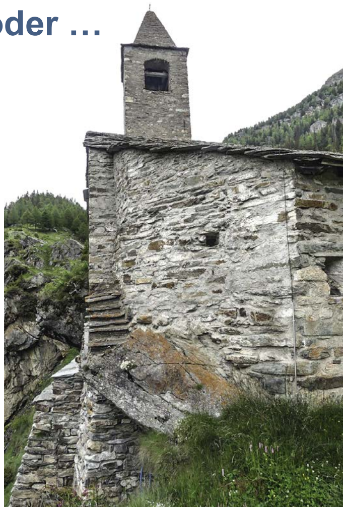
Kapelle San Romerio

Auch in Politik, Wirtschaft und Gesellschaft finden wir genügend Puzzleteile, die sich zum Bild vom Leben am Abgrund zusammenfügen lassen. Angefangen bei der noch nicht gelösten Bedrohung durch das Corona Virus, über die negativen Auswirkungen des entfesselten Welthandels und der hemmungslosen Konsumwut bis hin zur schreienden Ungerechtigkeit in Fragen der Bildungschancen, der Entlohnung oder der Altersvorsorge. Nicht zuletzt wären da noch die vielfältigen Auswirkungen der bedrohlichsten Krise, der Klimaerwärmung. Nach Meinung seriöser Fachleute aus verschiedenen Wissenschaftszweigen übersteigt diese Bedrohung alles. Vielleicht deshalb können bzw. wollen viele das immer noch nicht erkennen.