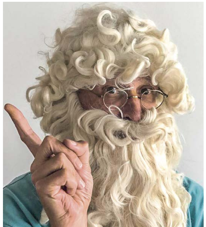
(mit 15-Fach-Zoom aufgenommen)