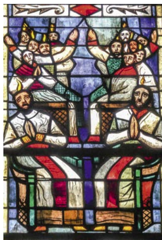
Glasfenster Pfingsten von Romainmôtier

Machtstreben, Machterhalt und Systemfestigung sind die wesentlichen Ursachen der genannten Krisen in Kirche, Politik, Wirtschaft und Gesellschaft. Die Lösung dieser Krisen kann nur in einer Bewegung weg von den menschlichen Abgründen der Macht und Gier bestehen. Aus diesen Abgründen können uns nur bewegte Menschen erlösen. Das erkannte auch der Wanderprediger, der mit seinen Gefährtinnen und Gefährten vor rund 2000 Jahren die Menschen seines Volkes Israel zu bewegen versuchte. Er wollte keine starre, weltumspannende Institution errichten, sondern die Menschen zur Umkehr bewegen.