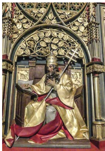
Detail aus Kanzel der Pfarrkirche Poschiavo