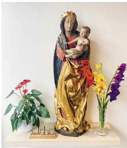
Madonna in Zollikon.