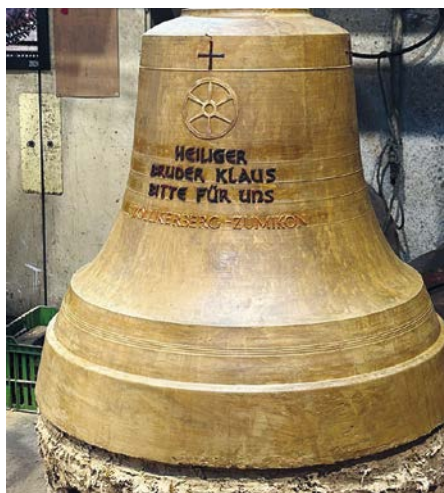
Die «falsche» Glocke mit der künftigen Zier.

Das Rad-Symbol geht auf das Meditationsbild des Heiligen Bruder Klaus zurück, eine christlich-abendländische Meditationspraxis, welche den Heiligen ent-