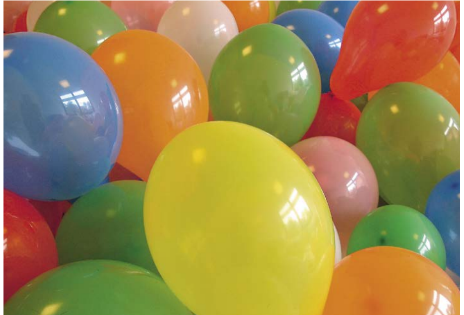
aj Ein Ferienprogramm, das alle Sinne anspricht.

Weitere Informationen finden Sie auf unserer Homepage www.kath-zollikon-zumikon.ch unter herbstferienprogramm. Wir freuen uns auf zahlreiche Anmeldungen.