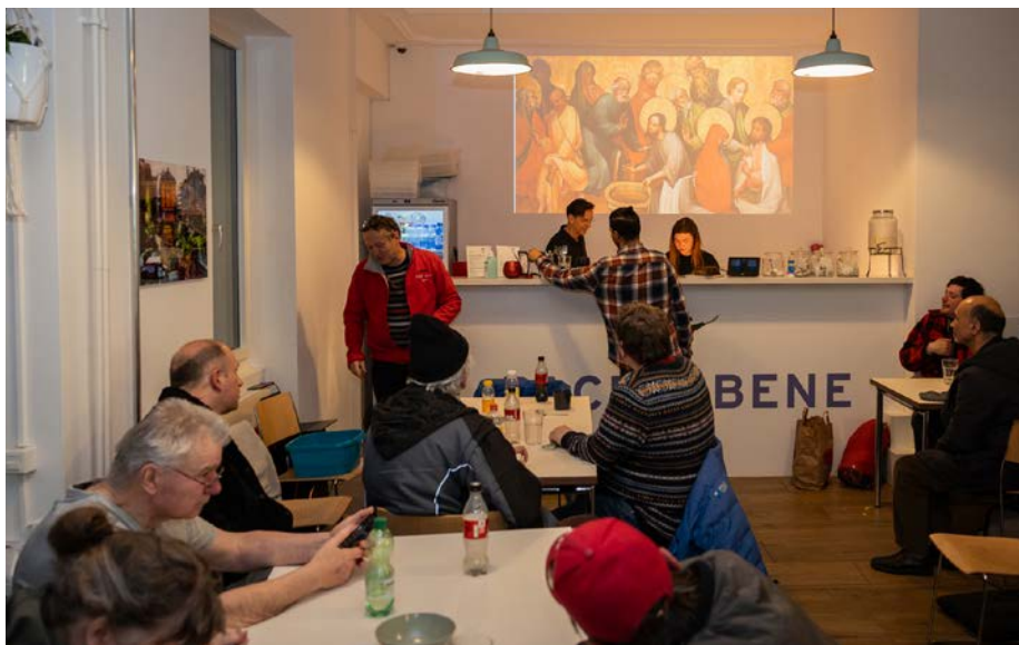
Begegnung im Haus Zuflucht

Der Verein ist ein fester Bestandteil der sozialen Landschaft Zürichs. Mitarbeitende suchen obdachlose und isolierte Menschen auf, leisten Überlebenshilfe und fördern Eigenverantwortung. Im Zentrum der Arbeit steht einerseits das franziskanische Menschenbild und andererseits das Prinzip «Beziehung statt Bürokratie». Einrichtungen wie das Haus Zuflucht oder das Gassenlokal Zuflucht Pace bieten Raum für Begegnung und Vertrauen. «Das erste Gespräch auf Augenhöhe kann der Beginn einer Veränderung sein», sagt eine Sozialarbeiterin. Die Unterstützung unserer Kirchgemeinde ermöglicht diese stille, aber unverzichtbare Form der Nächstenliebe mitten in der Stadt.