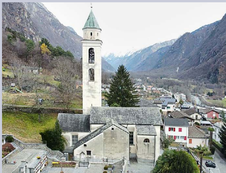
Chiesa di San Maurizio a Cama (GR)

Anlässlich des 60-Jahr-Jubiläums unserer Kirche St. Michael in Zollikoberg – mit der Einweihung einer sechsten Glocke – beschloss die Kirchenpflege, ausserhalb des Spendenbudgets eine besondere Unterstützung zu leisten. Unter Vermittlung der Inländischen Mission (IM) wird die Restaurierung der Pfarrkirche San Maurizio in Cama (GR) mit CHF 15 000 unterstützt. Der Beitrag dient der Reinigung der Aussenfassade, Entfeuchtung der Mauern und Instandsetzung des Kirchenmobiliars. Damit setzen wir ein Zeichen der Verbundenheit mit anderen Pfarreien und tragen dazu bei, kulturelle und geistliche Orte zu erhalten.