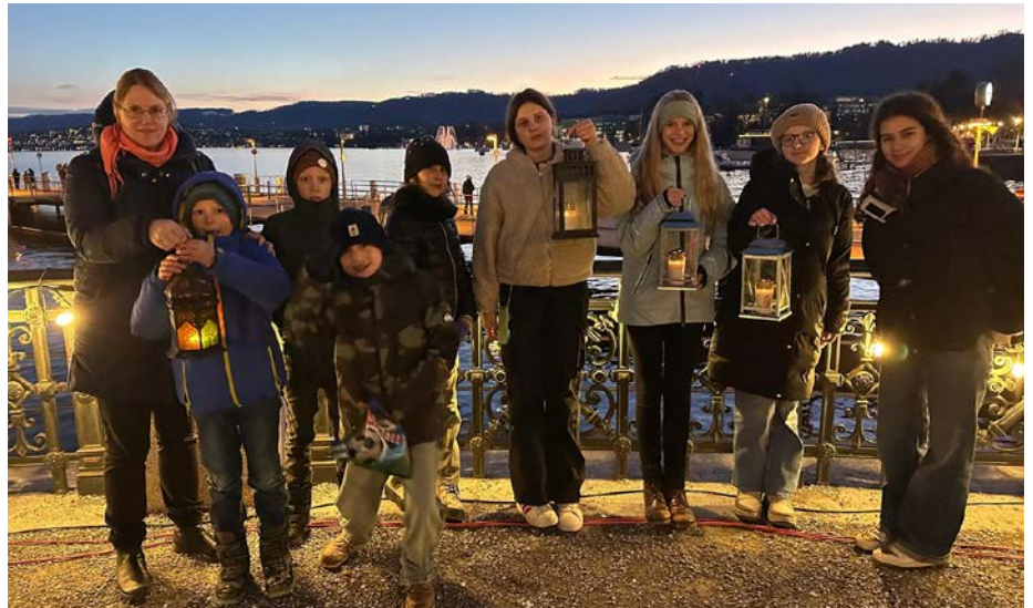
2024 - Die Minis holen das Friedenslicht