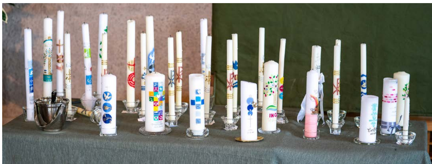
Die Taufkerzen unser Erstkommunionkinder