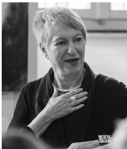
Christel Holl

Der gelbe Schein um die Frau ist wie anbrechendes Licht – nicht aus dieser Welt. Es ist die Ahnung, das Schloss kann nicht gewaltsam geöffnet werden, die Tür, die uns verschlossen scheint, wartet in Wahrheit auf die Begegnung mit dem Göttlichen. So wird die Collage aus Graffiti, Rost und Eisen zur Ikone des Advents in diesem Jahr: das Warten, das Hoffen, das stille Vertrauen, dass Gott in der Kälte der Welt Wohnung nehmen will. Die Mutter steht da, mitten unter uns, im Gebet: damit das