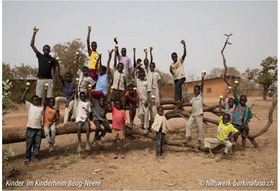
Kinder im Kinderheim Béog-Neeré