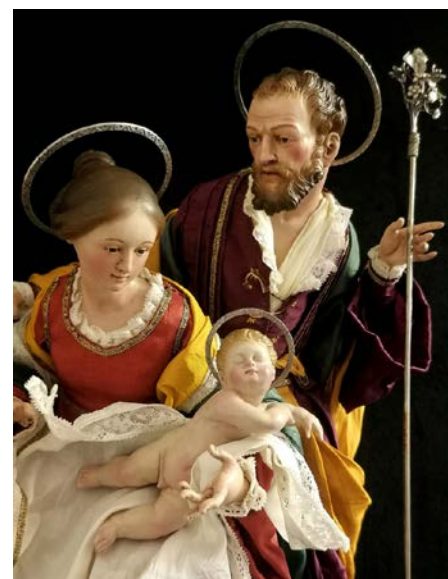
Werk aus dem Kunstatelier La Scarabattola