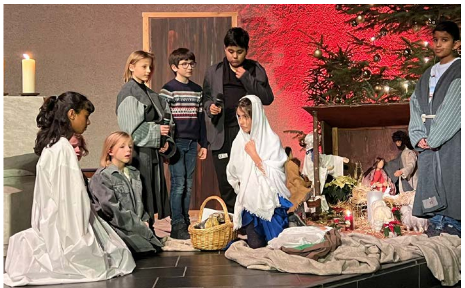
Unsere Untikinder beim Krippenspiel