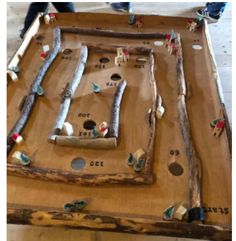
Alle Bilder dieser Seite